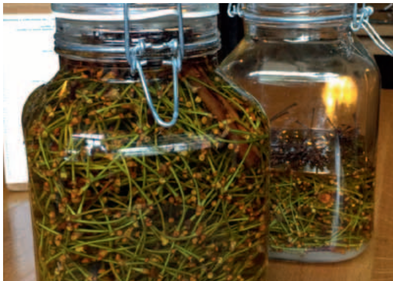
Kersensteeltjes zijn goed voor de nieren en voor het destilleren van brandewijn.

van carnavalsverenigingen, zoals De Spruwwejagers , De Kersepit en De Stillekes . Kapel De Kersenlanders is een van de nog bestaande blaaskapellen uit Mierlo, die werd opgericht als hofkapel van de kersenkoningin tijdens de jaarlijkse oogstfeesten. Hedentendage worden er nog weinig kersen geoogst. Er is nog maar één boomgaard die honderdvijftig bomen telt waarvan er tachtig, vijftig oude en dertig jonge geënte exemplaren, de echte Mierlose Zwarte dragen.