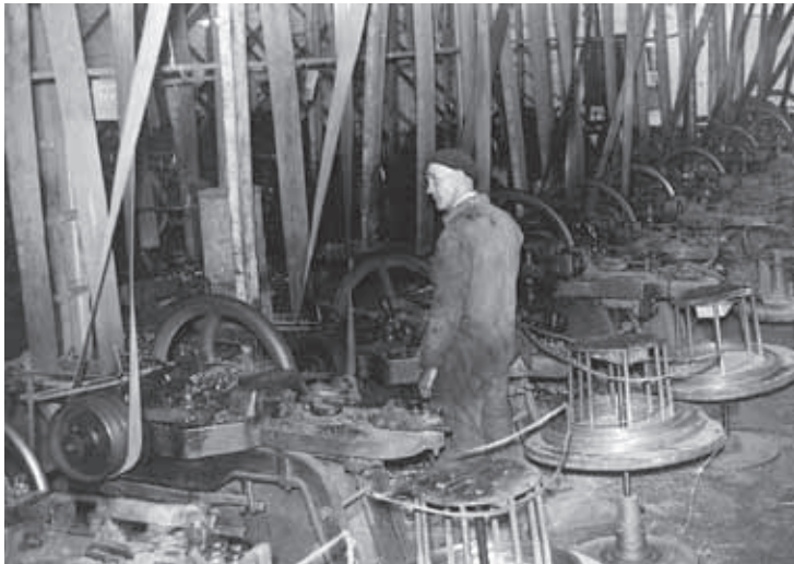
Van de firma Zwijsen zijn geen foto's bewaard gebleven. Om een indruk te geven van de werkzaamheden zijn hier twee foto's te zien van de spijkerfabricage bij J.H. de Wit in jaren zestig. De Wit was vermoedelijk in het voormalig bedrijfspand van Zwijsen gevestigd en had een groot deel van de machines overgenomen. Boven zien we de spijkermachines en onder de beitserij.

1924 van start gegaan. Blijkbaar was het maatschappelijk kapitaal al gauw niet voldoende, primo 1925 vond uitbreiding tot f 160.000 plaats. Het avontuur duurde zowat een jaar, begin augustus 1925 werd het faillissement uitgesproken. De stopzetting van het bedrijf betekende onder meer dat 50 werklieden zich bij de gemeentelijke Arbeidsbeurs meldden, maar deze vonden bijna allen binnen een paar weken elders werk.