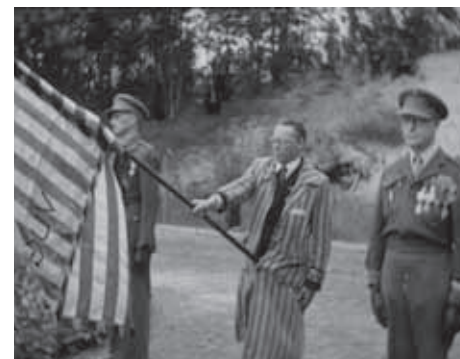
Enkele beelden uit de korte film over de herdenking van 1946 door oud-gevangenen in kamp Vught.