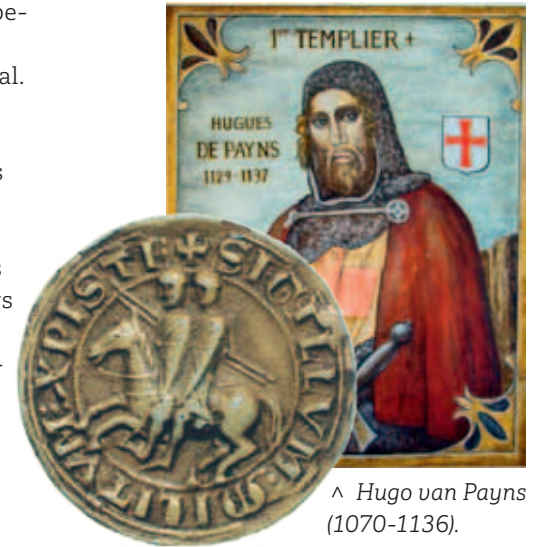
^ Hugo van Payns (1070-1136).