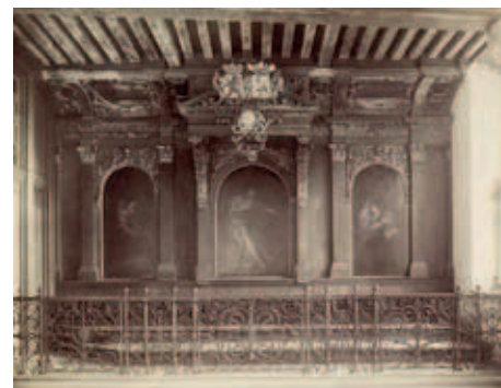
Interieur van een schepenbank. De schepenbank was aanvankelijk een lokale rechtbank, maar ontwikkelde zich later tot een politiek orgaan dat vergelijkbaar is met de tegenwoordige gemeente.

Eindhoven wilde de zaak laten berusten. Omdat de Helmondse schepenbank weigerde, werden beide partijen gedaagd. Helmond dacht het hoogst in rang te zijn, omdat Peelland van alle gewesten het eerst werd genoemd. Wilde de stad zich aan de jurisdictie onttrekken, dan moest zij bewijzen dat Eindhoven buiten Peelland lag. Ook het beroep op gelijkheid ging niet op. Helmond had