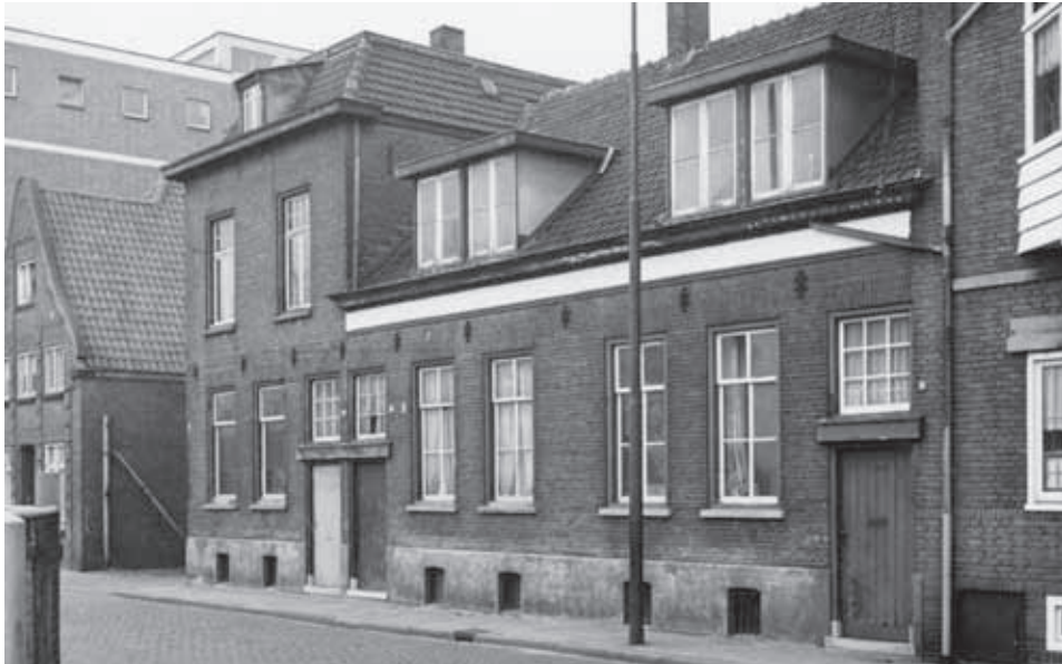
De bedrijfspanden van Vringer in de jaren zestig kort voor de sloop. Rechts is nog een stukje van het woonhuis te zien waar de familie woonde. Het pand had een onderdoorgang die leidde naar het binnenterrein.

uit Utrecht. Van Zanten houdt het al na een jaar voor gezien en vertrekt naar Leeuwarden. Hij vraagt aan Vringer of hij het bedrijf wil overnemen. In De Zuidwillemsvaart van 31 juli 1909