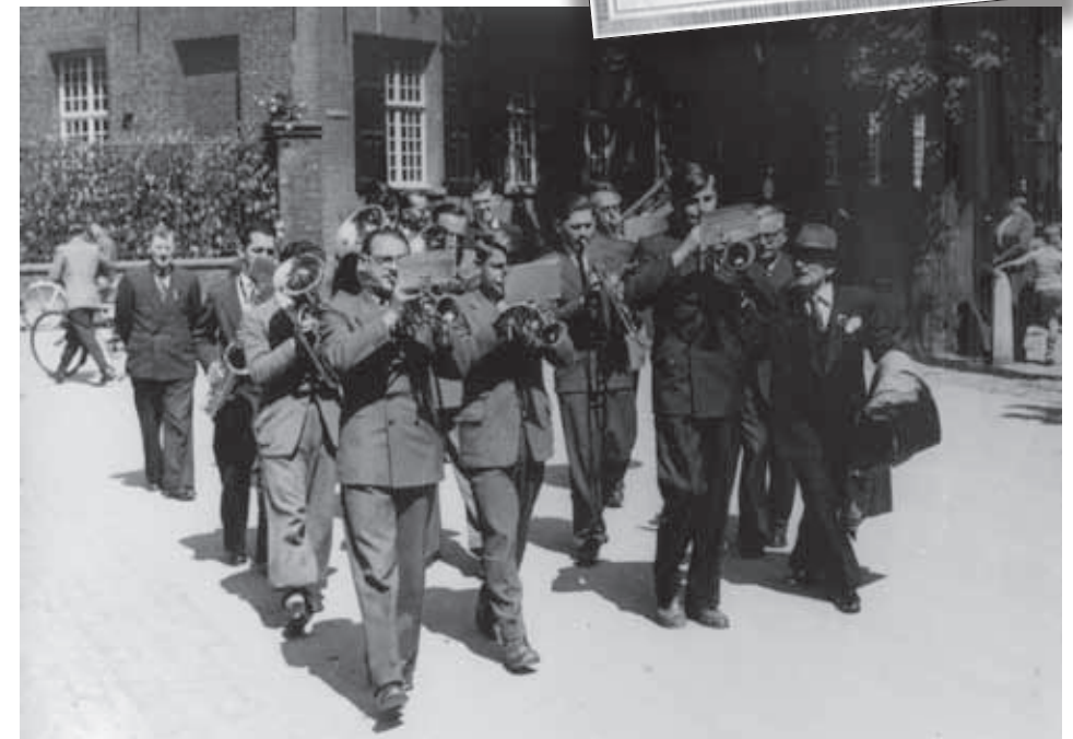
Fanfare De Vooruitgang presenteert zich met een van de eerste muzikale wandelingen tijdens een processiegang door Kevelaer. Al na twee jaar volgde een concert met een volledig programma.