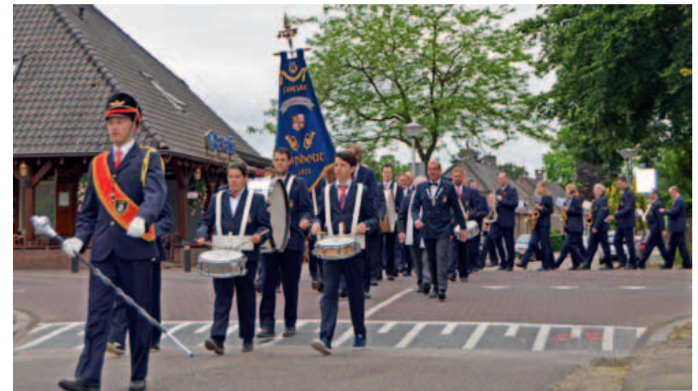
Tijdens de jaarlijkse 'Buitendag' wordt heel Stiphout doorkruisd om verdienstelijke Stiphoutenaren een serenade te brengen.

Overal waar Fanfare De Vooruitgang komt, is zij een welkome gast. Dat geldt in het algemeen, maar zeker voor Stiphout. Vanzelfsprekend kan het korps niet altijd en overal aanwezig zijn, maar als het mogelijk is, en het een respectabel doel betreft, zal het acte de présence geven. De verbondenheid met de bewoners van Stiphout is groot. De fanfare zit geworteld in de harten van de bevolking, dat mag met name blijken uit de donaties die het gezelschap in het verleden mocht ontvangen. De fanfare realiseert zich dat zij door de inwoners wordt gesteund. De opbrengsten van donateurs- en papieracties, maar ook de club van 100, case quo vrienden van De Vooruitgang, maken het mogelijk om hoogwaardig te blijven functioneren. «