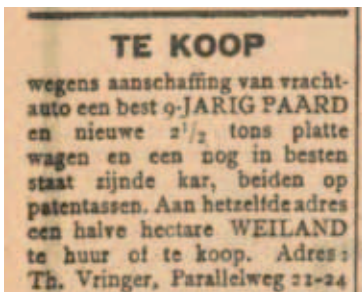
In mei 1924 schakelde Vringer over op gemotoriseerde paardenkrachten. Zijn paard, platte wagen en wei werden te koop aangeboden. Rechts een advertentie uit de Zuidwillemsvaart van 20 december 1913.

verschijnt een bericht van deze overdracht. Kort daarop komt broer Antoon Vringer ook naar Helmond en beide broers zetten het bedrijf voort als bierbottelarij en limonadefabriek. Antoon