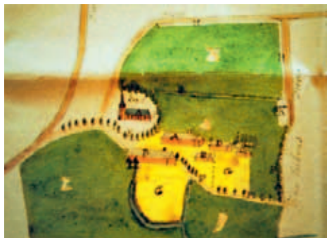
Plattegrond van de kerk van Rixtel en de Maltheserhoeve. (Afbeelding uit: J. Coenen, Van Ricstelle tot Aarle-Rixtel)

Rond 1930 werd de hoeve herbouwd. (afbeelding: internet)