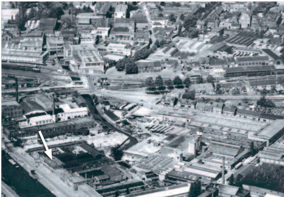
Luchtopname uit 1956 van het gebied rond 'de Oliemeulen' met daarop vooral de fabrieken van de HTM. Linksonder is een stukje van de Zuid-Willemsvaart te zien en bij de pijl de voormalige fabriek van Zwijzen. Het pand lag ingeklemd tussen het kanaal en een lus van de OudeAa.

de eigenlijke draadnagelfabriek uit een zolder, magazijn, pakkerij, smederij, stookplaats en een grof- en fijntrekkerij. De smederij omvatte naast werkbanken een gemetselde smidse, koudijzerzaagmachine, kolomboormachine, sterkearmschaafmachine en draaibank. De belangrijkste machines in de draadnagelfabriek: acht draadnagelmachines en zeven draadnagelslagmachines naast een krammenmachine. De stookplaats omvatte een stoomketel die diende voor verwarming van onder meer de nabij gelegen zuurbakken en kalkbak, gloei- en droogoven. Een bijzonderheid was de elektrische loopkraan in de stookplaats, met een hijsvermogen van 5000 kg, die over houten loopbalken met ijzeren rails